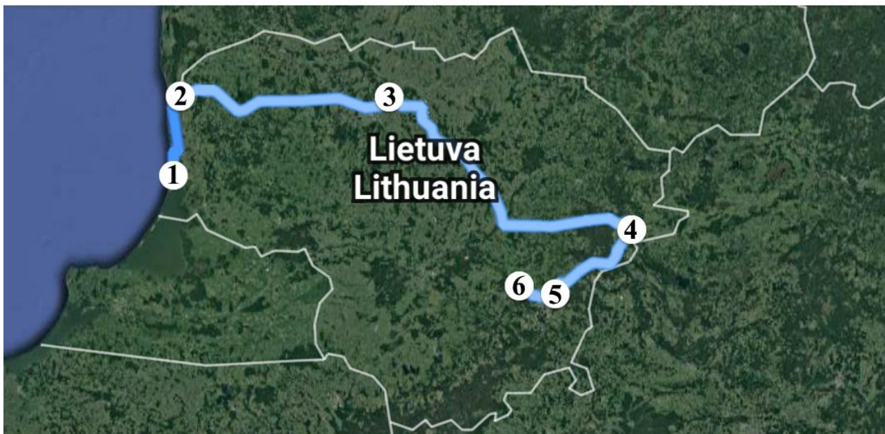
Turistinio maršruto po Lietuvos mitologinius parkus schema