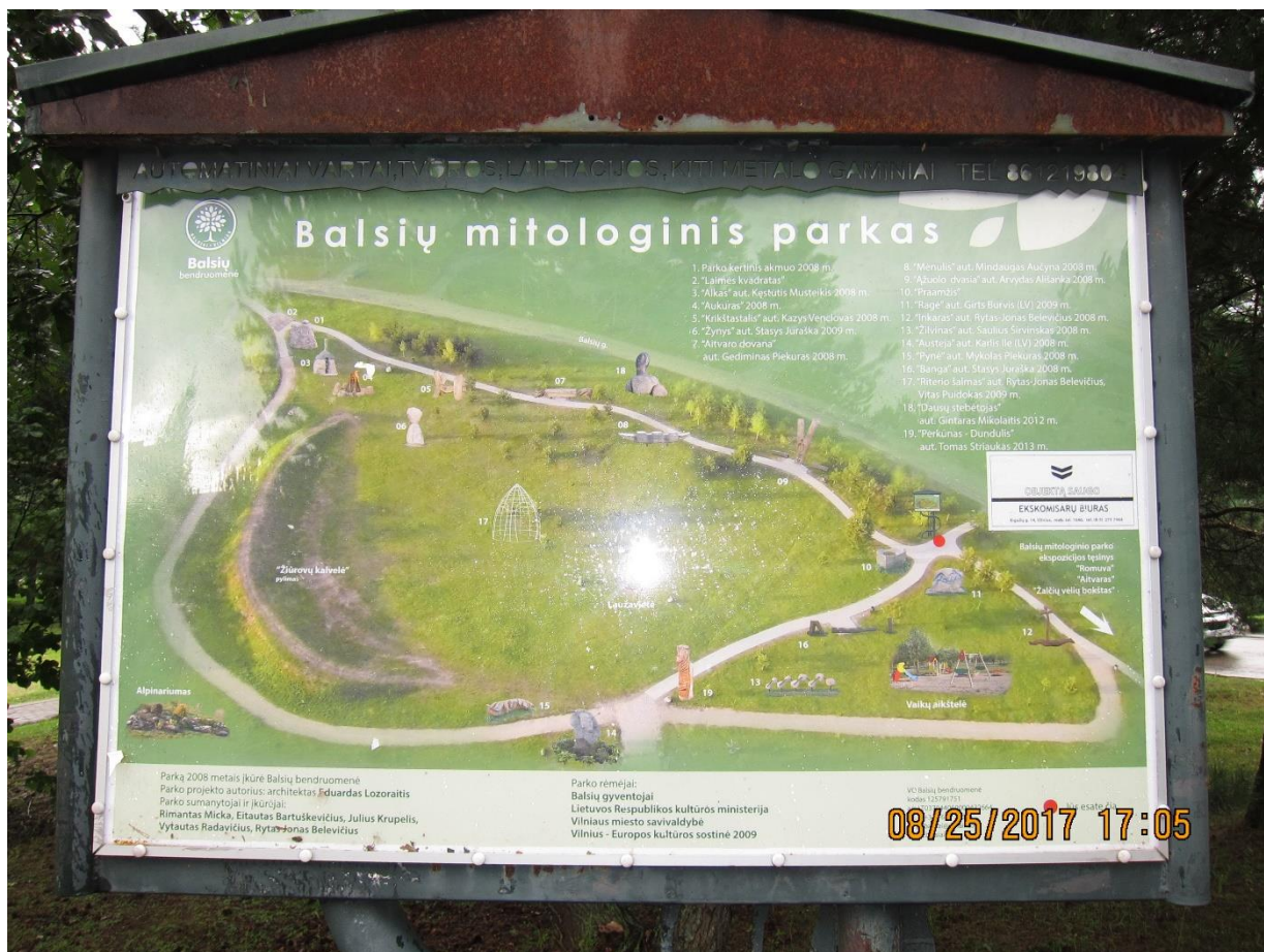
Balsių mitologinio parko schema